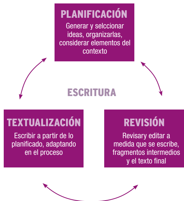
Figura 1. Procesos recursivos de la escritura

La escritura ocurre como una serie de procesos recursivos (Bereiter & Scardamalia, 1987; Didactext, 2015; Flower & Hayes; 1981, Hayes, 1996) en los que se despliegan diferentes estrategias, tal como se indica en el siguiente esquema: